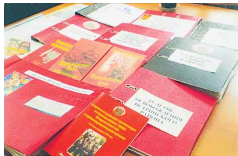
В папках собраны сведения об истринцах - участниках войны