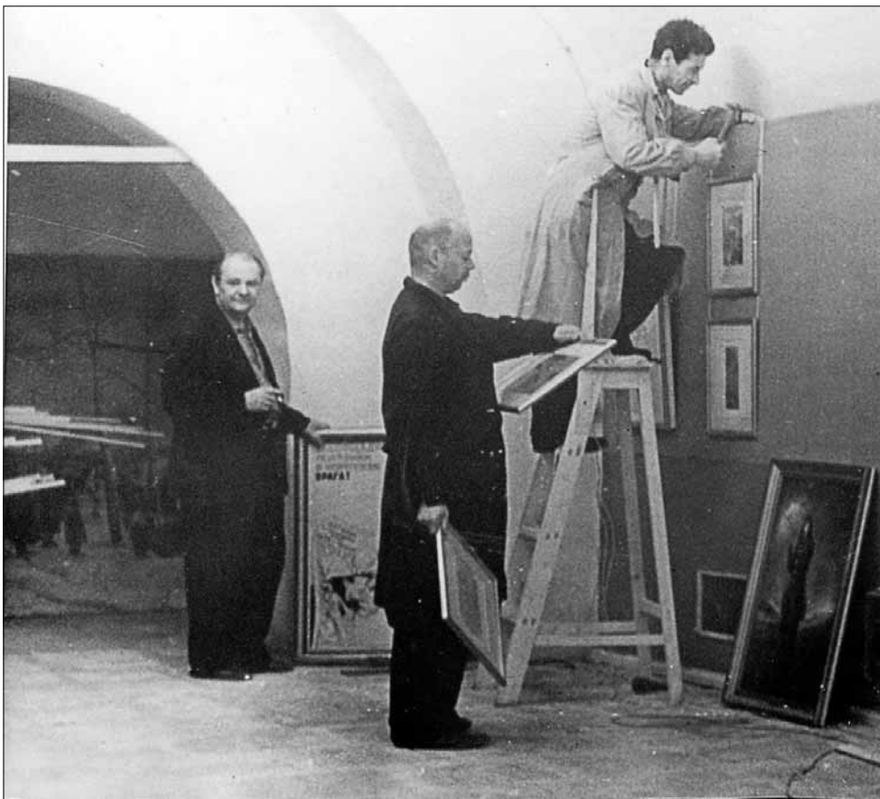
Монтаж экспозиции в музее «Новый Иерусалим» (ок. 1960 г.)