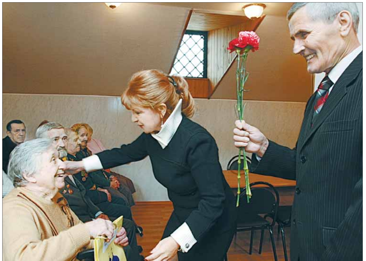
Вручение ключей и документов на собственное жильё

Теперь все ветераны Великой Отечественной войны Истринского района имеют собственную жилплощадь