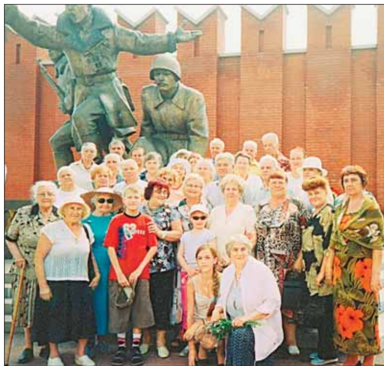
Ветераны и молодёжь - у мемориала в Снегирях